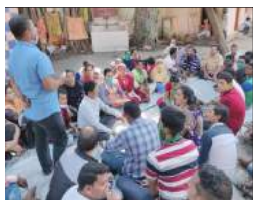
ନିମନ୍ତେ ନୂତନ ଏକେସ୍‌ସିପ୍‌ସୁରରେ ଏକ କାର୍ଯ୍ୟାଳୟ ଖୋଲିବାକୁ ମଧ୍ୟ ଦାବି କରାଯାଇଛି । ପୂର୍ବରୁ ବ୍ରହ୍ମପୁର ବଡ଼ମେଡ଼ିକାଲର କାର୍ଯ୍ୟରତ ଆଡେକ୍ସାଏ ମେଡିକାଲ ସୁକୁରିଟି ଏକେସ୍‌ସିପିଆରେ ନିୟୋଜିତ ଥିଲେ । ବର୍ତ୍ତମାନ ନୂତନ ଏକେସ୍‌ସିପି ଦାୟିତ୍ୱ ନେବା ପରେ ବିଭିନ୍ନ ସମସ୍ୟା ସୃଷ୍ଟି ହୋଇଛି ।

ବ୍ରହ୍ମପୁର ବଡ଼ ମେଡ଼ିକାଲରେ କାର୍ଯ୍ୟରେ ଆରମ୍ଭ ହୋଇ କର୍ମଚାରୀଙ୍କୁ କାର୍ଯ୍ୟରେ ନିୟମିତ କରାଇବା ଦାବିରେ ଏଂଘ ପକ୍ଷରୁ ଏକ ବୈଠକ ଚକ୍ଷୁ ବିଭାଗର ନିକଟସ୍ଥ ହସ୍ପିଟାଲ ମନ୍ଦିରରେ ଅନୁଷ୍ଠିତ ହୋଇଯାଇଛି । ଏଥିରେ ରାଜ୍ୟକାର୍ଯ୍ୟ ୨୬୩ କର୍ମଚାରୀଙ୍କୁ କାର୍ଯ୍ୟରେ ଅବସାହିତ ରଖିବା, ପୂର୍ବ ଏକେସ୍‌ସିପ୍ ପାଖରେ ବକେୟା ଥିବା ୧୫ଦିନର ଦରମା ଓ ସରିୟର ଟଙ୍କା ଭୁରତ ପ୍ରଦାନ, କର୍ମଚାରୀଙ୍କ ଇନ୍‌ସୁରାନ୍ସ ଓ ପରିଚୟ ପତ୍ରରେ ହସ୍ତଗତାଳ ନାମ ଥାଇ ନୂତନ ପରିଚୟ ପ୍ରଦାନ କରାଯାଉ, ସୁପ୍ରିମ କୋର୍ଟ ନିର୍ଦ୍ଦେଶ ଅନୁସାରେ ସମାନ କାମକୁ ସମାନ ଦରମା, ସପ୍ଲାଇ ଛୁଟି, କର୍ମଚାରୀଙ୍କ ଜିପିଏଫ୍ ଓ ଇପିଏଫ୍ ଓ ଇଏସଆଇ ବକେୟା ଅର୍ଥ ଭୁରତ ଜମା କରିବା କୌଣସି କର୍ମଚାରୀଙ୍କ ମୂଲ୍ୟ ହେଲେ ପରିବାରକୁ ଆର୍ଥିକ ସହାୟତା ଯୋଗାଇଦା, କର୍ମଚାରୀଙ୍କ ସୁବିଧା