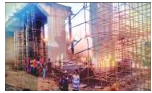
ଶ୍ରମିକମାନଙ୍କ ଉପରେ ସ୍ଥଳ ପଡ଼ିବା ଘଟିଥିଲା । ଖବର ପାଇ ଘଟଣାସ୍ଥଳରେ ଉପରକୋଟ ଥାନା

ଭୁବନେଶ୍ୱର, ୧୦।୧ ଏକ୍ସପ୍ରେସ୍ ନ୍ୟୁଜ୍ ନବରଙ୍ଗପୁର ଜିଲ୍ଲା ଭୁବନେଶ୍ୱରରେ ଆଜି ଏକ ନିର୍ମାଣାଧୀନ ପୋଲ ଭୁଗୁଡ଼ି ପଡ଼ିବା ଫଳରେ ଜଣେ ଶ୍ରମିକ ପ୍ରାଣ ହରାଇଥିବା ଜଣାଯାଇଛି । ଏହି ଦୁର୍ଘଟଣାରେ ଅନ୍ୟ ୬ଜଣ ଆହତ ହୋଇଛନ୍ତି । ସେମାନଙ୍କ ମଧ୍ୟରୁ ୩ ଜଣଙ୍କୁ ଗୁରୁତର ଅବସ୍ଥାରେ ଭୁବନେଶ୍ୱର ଡାକ୍ତରଖାନାରେ ଭର୍ତ୍ତି କରାଯାଇଛି । ମୃତ୍ୟୁ ହତ ଶ୍ରମିକମାନେ ପୁରୀ ଅଞ୍ଚଳ ବୋଲି