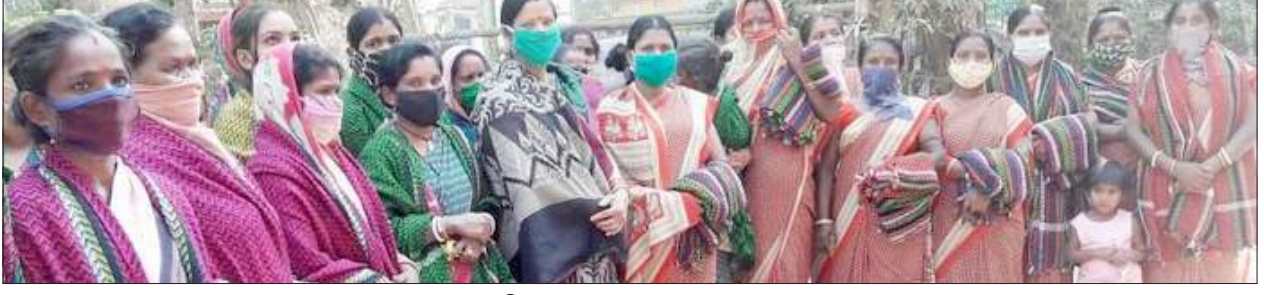
କଚକ : ଲିସା ଅନୁଷ୍ଠାନ ପକ୍ଷରୁ ମାଝ ଓ ଶୀତବସ୍ତ୍ର ବଣ୍ଟନ

ଲୋକଙ୍କ ନିକଟରୁ ଲକ୍ଷ ଲକ୍ଷ ଟଙ୍କା ଆଦାୟ କରିଥିଲେ । ତେବେ ନିର୍ଦ୍ଦେଶ ଅଧିକ ମଧ୍ୟରେ ଟଙ୍କା ନ ଫେରାଇବାକୁ ଟାଙ୍କି ନାମରେ ଅଭିଯୋଗ ହୋଇଥିଲା । କ୍ରାଇମ୍‌ଟ୍ରାଷ୍ଟର ଅର୍ଥନୈତିକ ଅପରାଧ ଶାଖା ମାମଲାର ଚପକଭାର ନେଇଥିଲା । ଏହି ମାମଲା କଚକର ଓପିଆଇଟି କୋର୍ଟରେ ବିଚାରସିନ ରହିଛି । ଅଭିଯୁକ୍ତଙ୍କ ବିରୋଧରେ ଆଇପିସିରେ ୪୦୬/୪୬୭/୪୬୮/୪୭୧/୪୨୦/୧୨୦-ବି ଏବଂ ଓପିଆଇଟିରେ ୬ ଧାରାରେ ଅଭିଯୋଗ ହୋଇଥିଲା । ଅନାଲତରେ ଟାଙ୍କି ବିରୋଧରେ ଅଭିଯୋଗଫର୍ଦ୍ଦ ଦାଖଲ କରାଯାଇଥିଲା । ଏଥିରେ ଅଭିଯୁକ୍ତ ଜଣକ ୬୨ଲକ୍ଷ ୭୯ ହଜାର ୨ ଶହ ଟଙ୍କା ହତପ କରିଥିବା ନେଇ ଅଭିଯୋଗ ଫର୍ଦ୍ଦରେ ଦର୍ଶାଯାଇଥିଲା । ହାଇକୋର୍ଟରେ ମାମଲାର ଶୁଣାଣି ବେଳେ ଅଭିଯୁକ୍ତଙ୍କ ପକ୍ଷରୁ ଦର୍ଶାଯାଇଥିଲା ଯେ ୨୦୧୯ ଜୁନ୍ ୧୮ ତାରିଖରୁ ସେ କେଲରେ ଅଛନ୍ତି । ସେହିପରି ଏହି ମାମଲାର ଚପକ ଶେଷ ହୋଇସାରିଛି ବୋଲି ଅନାଲତଙ୍କୁ ଅବଗତ କରାଯାଇଥିଲା । ଅନ୍ୟପକ୍ଷରେ ଏହି ମାମଲାରେ ଅଭିଯୁକ୍ତ ଜଣକ ଜମାକାରୀଙ୍କୁ ୧୭ ଲକ୍ଷ ୪ ହଜାର ଟଙ୍କା ଫେରତ୍ତ କରିସାରିଛନ୍ତି ବୋଲି ଦର୍ଶାଯାଇଥିଲେ ।