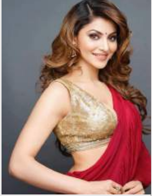
ଅଭିନୟ କରିବାକୁ ଉତ୍ସୁକତାର ସହ ଅପେକ୍ଷା କରିଛି । ଏହି ବର୍ଷର ଆରମ୍ଭ ମଧୁବାଳା ଜଣେ ଆଇକନ ଥିଲେ ଯିବ କେବଳ ନିଜ ସୁନ୍ଦରତା ପାଇଁ ନୁହେଁ ବରଂ ସ୍ତ୍ରୀମେଡିକାଲ କଲେଜର ଶିକ୍ଷା ସୌଧ ନିର୍ମାଣ ପାଇଁ ସମ୍ପୃକ୍ତ ମନ୍ତ୍ରପୁସ୍ତ କରିଥିଲା । ସେ ତାଙ୍କର ଏକ ଭିନ୍ନ ଛାପ ଛାଡି ଯାଇଛନ୍ତି ।