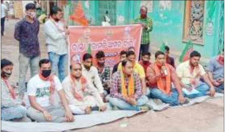
କଚକ : ବିଭିନ୍ନ ଦାବି ନେଇ ବିଜେପି ପକ୍ଷରୁ ମଙ୍ଗଳାବାର ଠାରେ ରାଷ୍ଟ୍ରୋଦ୍ଧ

ରହିଥିବା ଜଣାପଡ଼ିଛି । ଛାତ୍ରଛାତ୍ରୀ ମାଝ ହାତରେ ଗ୍ଲୋପସ୍ ପରିଧାନ କରି ବିଦ୍ୟାଳୟକୁ ଆସିଥିଲେ । କୋଭିଡ଼ - ୧୯କୁ ଭୟ ନକରି ଛାତ୍ରଛାତ୍ରୀ ବିଦ୍ୟାଳୟରେ ସାମାଜିକ ଦୂରତା ରକ୍ଷାକରି ପାଠପଢ଼ା ଆରମ୍ଭ କରିଥିଲେ । ପ୍ରତ୍ୟେକ ସ୍କୁଲ ଗୁଡ଼ିକରେ ସରକାରୀ ନିୟମ ଅନୁସାରେ ବସୁଥିବା କୋଭିଡ଼ - ୧୯ ରାଜକର୍ତ୍ତାଙ୍କ ନିୟମ ଅନୁଯାୟୀ ଶ୍ରେଣୀ ଗୁହଗୁଡ଼ିକୁ ଶିକ୍ଷକମାନେ ସାମାଜିକ ଦୂରତା ପରିଷ୍କାର ପରିଚାଳନା କରି ଥିଲେ ଓ ପ୍ରତ୍ୟେକ ସ୍କୁଲ ଗୁଡ଼ିକରେ ଆଇସୋଲେସନ୍ ବ୍ୟବସ୍ଥା